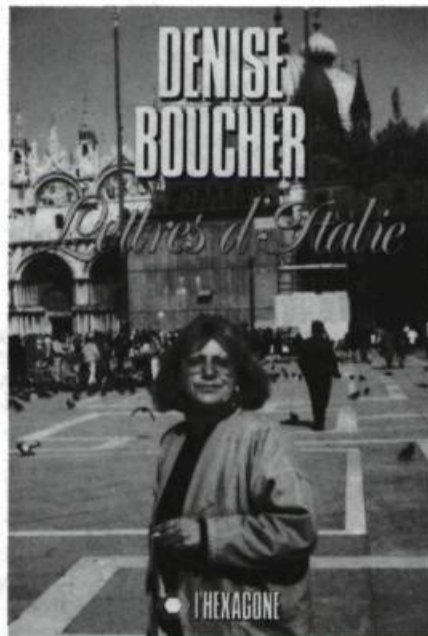
Lettres d'Italie de Denise Boucher, Montréal, L'Hexagone, 1987, 112 p., (coll. Itinéraires littéraires), 14,95$.

Une vieille tradition humaniste, doublée sporadiquement sur la gauche, au cours des ans, par diverses modes intellectuelles, a contribué à faire depuis toujours de l'Italie le lieu chéri des voyageurs curieux de la découverte de mondes anciens, amateurs de rondbosse et de belles-lettres ou tout simplement amoureux d'un certain art de vivre. Rome la capitale a attiré, pour sa part, à elle seule, depuis des siècles, dans le giron de la ville éternelle, des milliers de mortels venus du monde entier.