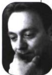
Michel Marc Bouchard

Il est donc tout à fait judicieux que le second conte contenu dans ce livre, Joyeux Noël Julie , soit le récit d'une vengeance, celui d'un groupe de femmes qui décident de se faire justice et de rendre la monnaie de sa pièce à un violeur qui a fait périr l'une de leurs amies.