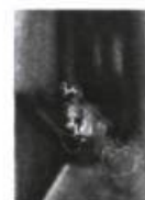
Sylvie Nicolas Œuvres de Jacques Jourdain