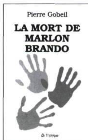
Pierre Gobeil LA MORT DE MARLON BRANDO Roman, 135 p., 12 $

«Guy Perreault a su rendre particulièrement palpable l'omniprésence, la toute-puissance et le caractère irrémédiable de cette scission opérée par le départ de l'Autre dans la facture même de son texte.» Blandine Campion, Le Devoir