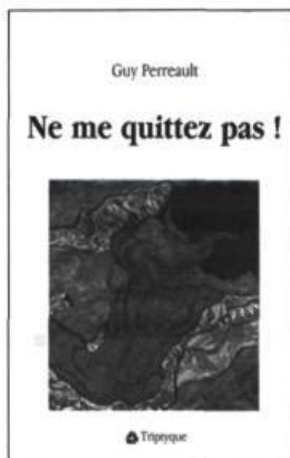
Guy Perreault NE ME QUITTEZ PAS! Récits, 112 p., 17 $

Un numéro exceptionnel! Un thème incontournable! MCEBIUS, une revue qui se démarque par son éclectisme et son acharnement à valoriser la découverte de nouvelles voix. 10 $ en kiosque