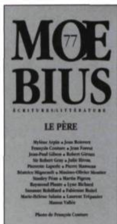
MCEBIUS n° 77 LE PÈRE

Tél. et téléc.: (514) 597-1666 Site Web: www.generation.net/tripty