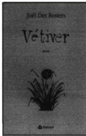
Joël Des Rosiers VÉTIVER Poésie, 145 p., 25 $

Trois narratrices nous content ici l'histoire d'une famille réunie pour la triste circonstance d'un décès. En de très courts chapitres, les narratrices donnent leur « vision des choses », soupèsent leur marge d'erreur et évaluent les comportements. Il n'est pas question de procès, mais plutôt de mises en perspective subtiles qui créent une atmosphère de réalité, et même de vérité, face à laquelle le lecteur ne peut qu'être confronté.