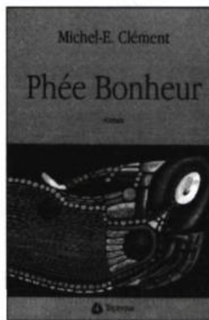
Michel-E. Clément PHÉE BONHEUR Roman, 281p., 22 $

Tout un essaim de personnages bourdonnent autour d'une héroïne charismatique à souhait. Elle s'appelle Phée. En pleine Deuxième Guerre, après son mariage avec un veuf, elle troque sa vocation d'institutrice contre celle de boulangère. Enseigner lui avait communiqué la grâce d'allumer les intelligences. La boulangerie lui apprendra à pétrir les âmes. Une formidable reconstitution du Québec d'après-guerre: 1943-1959.