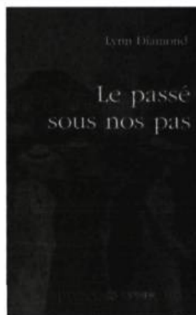
Lynn Diamond LE PASSÉ SOUS NOS PAS Roman, 166 p., 18 $

Tél. et téléc.: (514) 597-1666 Site Web: www.generation.net/tripty