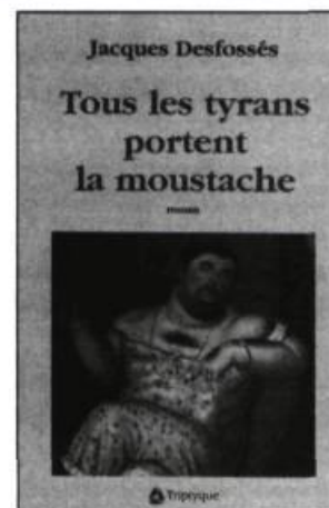
Jacques Desfossés TOUS LES TYRANS PORTENT LA MOUSTACHE Roman, 280 p., 22 $

Tout un essaim de personnages bourdonnent autour d'une héroïne charismatique à souhait. Elle s'appelle Phée. En pleine Deuxième Guerre, après son mariage avec un veuf, elle troque sa vocation d'institutrice contre celle de boulangère. Enseigner lui avait communiqué la grâce d'allumer les intelligences. La boulangerie lui apprendra à pétrir les âmes. Une formidable reconstitution du Québec d'après-guerre: 1943-1959.