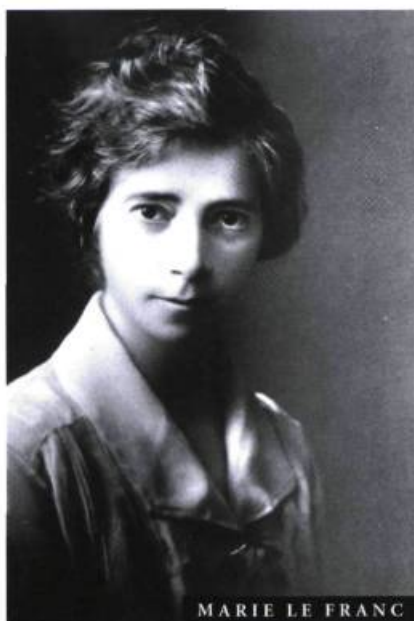
MARIE LE FRANC