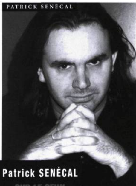
Patrick SENÉCAL SUR LE SEUIL

Fleur d'Auteuil, 32 ans, est une restauratrice d'œuvres anciennes qui n'en peut plus de pleurer la mort de sa mère, la froideur de son père et l'absence d'un homme bon dans sa vie. Pendant que son frère, criminologue, essaie vaguement de trouver qui peut donc bien s'amuser à placer des alaises bleues sous