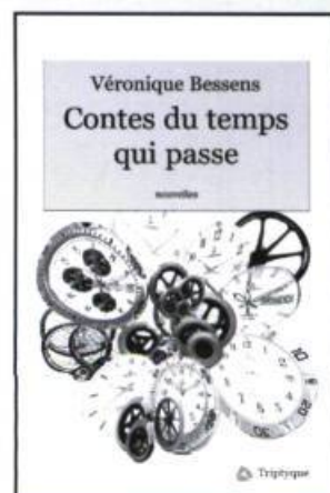
VÉRONIQUE BESSENS Contes du temps qui passe nouvelles, 137 p., 18 $