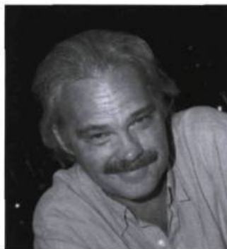
JEAN MARC DALPÉ