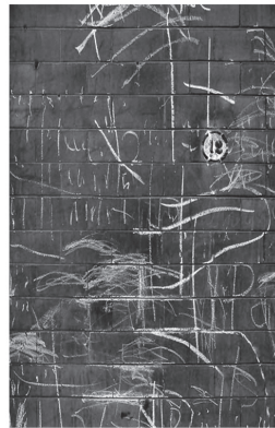
Éditions du Noroît