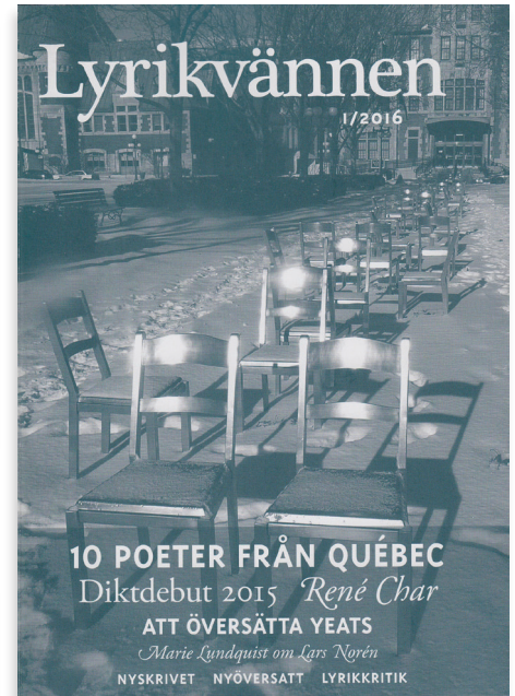
L'importante revue Lyrikvännen , dont le premier numéro de 2016 présentait dix poètes du Québec.

Une anecdote racontée lors de notre visite privilégiée de la Bibliothèque Nobel et des espaces somptueux de l'Académie suédoise, où est annoncé annuellement le lauréat ou la lauréate du prix Nobel de littérature, a achevé de me convaincre de la valeur sacrée de la culture et de la littérature en Suède. Au matin de la remise du Nobel, le Roi de la Suède est présent. Avant de se diriger vers son siège, devant une salle solennellement debout, le monarque s'incline devant le Président de l'Académie, geste symbolique de déférence du pouvoir royal devant la Littérature. Traitez-moi