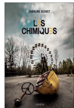
☆☆ Caroline Devost Les chimiques Montréal, Leméac 2019, 192 p., 22,95 $

Les chimiques n'est pas un mauvais livre. L'intrigue est complexe et se penche avec érudition sur plusieurs enjeux cruciaux. Les bonnes idées ne manquent pas. Les fulgurances, par contre, se font rares. Hélène, la protagoniste principale, est incarnée avec beaucoup de maladresse. La langue de Caroline Devost manque de caractère. Un phrasé incendiaire pour un récit nucléaire, voilà ce que nous avons anticipé... ♦