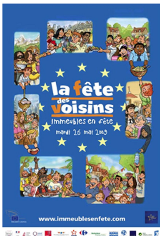
Affiche de 2009