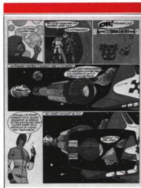
Illustration de Robert Héner tirée de l'album Le grand silence

talent; tant et si bien que le lecteur poursuivra sa lecture jusqu'à la fin sans ennui. Il faut signaler la mise en pages dynamique qui agrément la lecture.