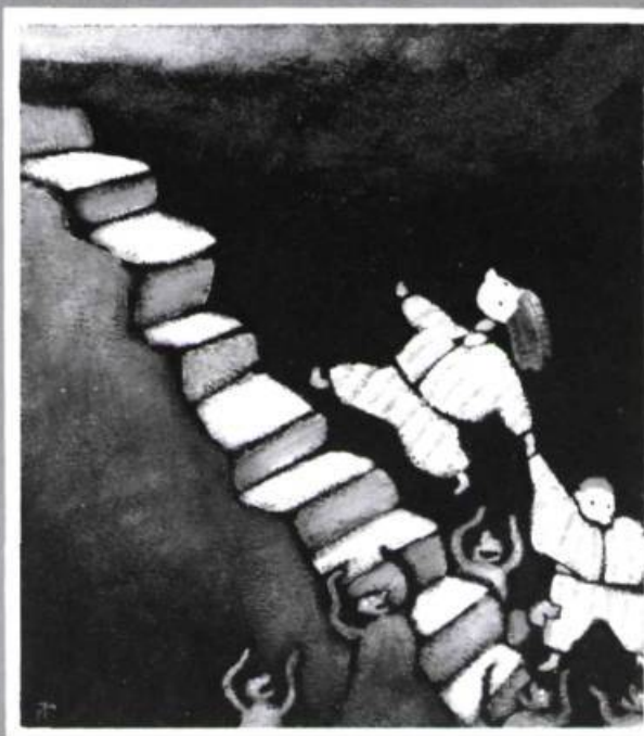
illustré par Pierre Pratt

Elle descend en testant chaque marche du bout du pied.