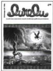
50 (vol. 19, n° 1) Printemps-Été 1996 Le théâtre du Gros Mécano. Les albums de BD pour jeunes. Entrevue : Jean Lemieux, écrivain.