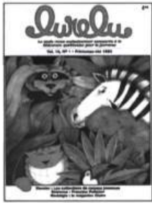
41 (vol. 16, n° 1) Printemps-Été 1993 Dossier : Les collections de romans jeunesse. Entrevue : Francine Pelletier, auteure.