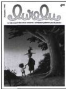
51 (vol. 19, n° 2) Automne 1996 Dossier : Théâtre jeune public, le texte dramatique. Réal D'anjou, pionnier québécois de l'édition pour jeunes. Entrevue : Anne Ville-neuve, illustratrice.