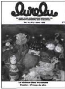
43 (vol. 16, n° 3) Hiver 1994 Dossier : L'image du père dans les romans. Entrevue : Michel Lupens, éditeur. La violence dans les romans.