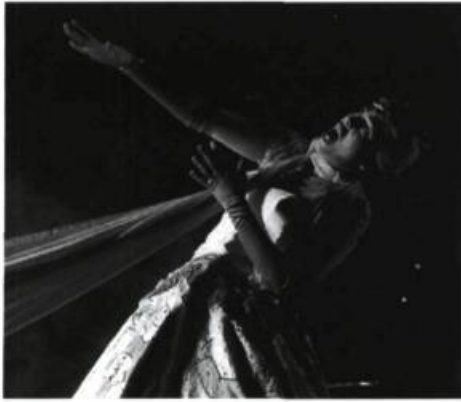
Valérie Le Maire dans Le Jardin des songes .