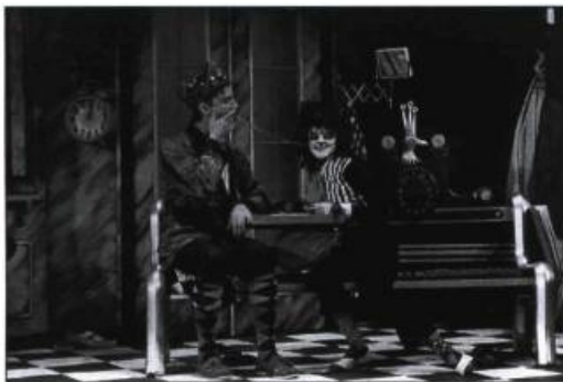
Monsieur Léon (1989) de Serge Marois, qui a présenté 122 représentations au Québec, en Ontario, en France et en Suisse.