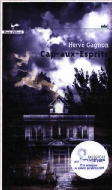
Illustration : Laurine SPRINGER