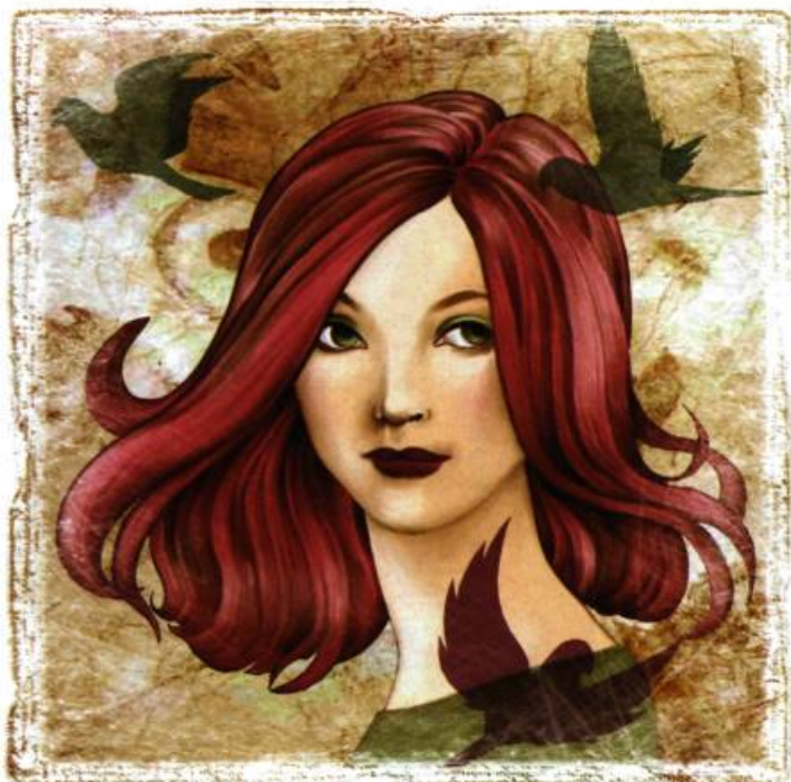
Illustration : Laurine Spehner

Josiane Ferron est une belle-maman de vingt-trois ans. Elle aime manger les crêpes au sarrasin que lui font ses deux belles-filles, vernir les ongles de ses voisines, faire du yoga devant des séries télévisées, écrire des histoires pour grandes et moins grandes personnes. Elle rêve de devenir maman à son tour, de réussir les meilleures compotes mangues-bleuets du monde et d'inventer des histoires de princesses un peu chiantes, mais surtout craquantes.