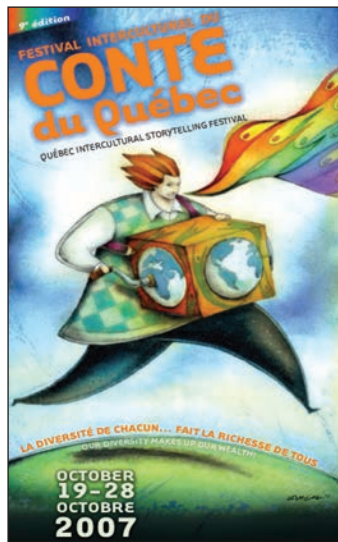
Affiche de Benoît Laverdière pour le 9 e festival.