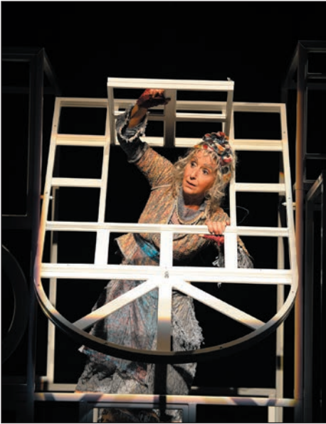
Le plus court chemin entre l'école et la maison

propositions qui plaisent à tous au détriment de créations plus audacieuses. Et puis, il est vrai que c'est exigeant pour un professeur d'amener toute sa classe au théâtre. La diffusion du théâtre jeunes publics est souvent liée à la passion de quelques profs. Ce n'est pas normal, il me semble que cela devrait faire partie du cursus même de formation des enseignants : le développement de la sensibilité par l'art, la curiosité, etc. L'art formateur, ce n'est pas vraiment entré dans nos mœurs, et on n'a pas des dirigeants politiques pour qui cela semble prioritaire...»