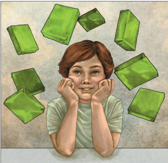
illustration : Laurine Spehner

Maxime observa le paquet, à peine plus grand qu'une main, et se dit que l'homme devait sûrement souffrir de la faim, même s'il se dépensait peu, assis dans son fauteuil roulant. Le jour suivant, Maxime attendit le vieux monsieur. Quand celui-ci vint chercher son paquet, Maxime lui tendit un sac de papier. En y découvrant un sandwich, une pomme, une tablette de chocolat et un berlingot de lait, l'homme resta un moment silencieux, puis éclata de rire.