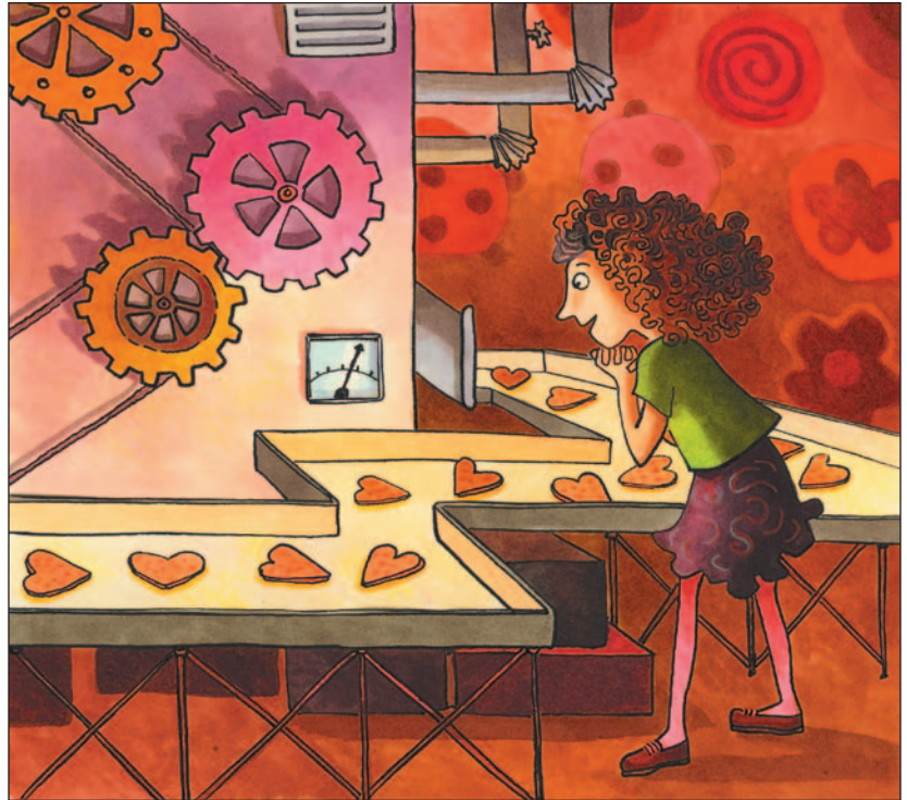
illustration : Caroline Merola

– Euh.... Bonjour, murmure-t-elle poliment, tout en se rapprochant de son oncle, qui sourit et lui prend la main.