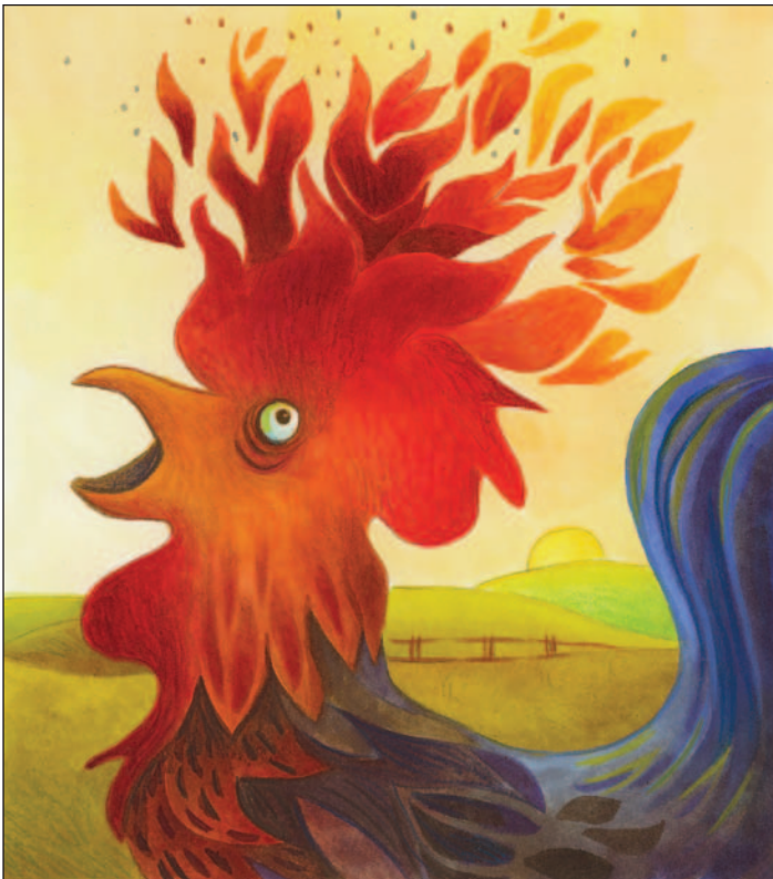
illustration : Caroline Merola

poules. Parce que moi, je suis comme une sentinelle, je patrouille sans relâche ma bassecour. Malheur à celui qui ose s'aventurer sur mon territoire, à l'exemple de «ce chenapan de Roméo», comme le décrit si bien le père Mathurin.