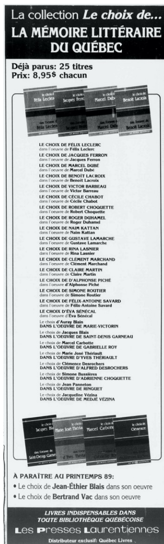
Figure 1. Publicité pour la collection « Le choix de... » des Presses laurentiennes, Le Devoir , 25 mars 1989, p. 7.

textes introductifs font écho aux « résumés » disponibles sur la quatrième de couverture et qui, là encore, jouent la carte du caractère nécessaire et universel d'une œuvre. Tantôt repris de textes parus ailleurs (un discours à l'Université du Québec pour Félix Leclerc, un extrait de l' Anthologie de la littérature québécoise de François Hébert pour Medjé Vézina), tantôt rédigés par l'éditrice ou par un collaborateur 20 , les « résumés » multiplient les références aux œuvres et aux prix et hommages obtenus par l'individu honoré, tout comme ils usent d'un ton laudatif pour honorer une écriture et un parcours exceptionnels — ce que les communiqués et prospectus vont continuer de faire dans les journaux et revues (figures 1 et 2).