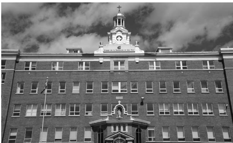
Depuis 1968, les Gaspésiens ont accès aux études collégiales. Le Cégep de la Gaspésie et des îles à Gaspé. Photo : Jean-Marie Fallu, 2009.

subventions au transport de marchandises en région (1999) est un autre coup dur pour la survie du train en Gaspésie. La même situation prévaut en transport maritime. Transports Canada met en place (1995) un programme d'abandon de ses ports, de ses quais et de ses phares. Une liaison maritime, établie entre Carleton et les Îles-de-la-Madeleine (1995), sera abandonnée (1996) et reprise entre Chandler et Les-Îles (2000). En 1994, le fédéral se retire également de la propriété et du financement des aéroports locaux et régionaux.