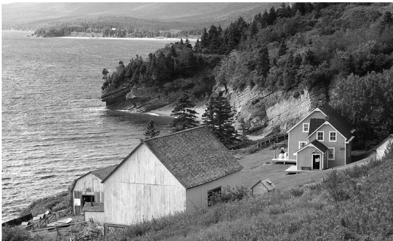
L'anse Blanchette dans le parc national Forillon, une image de marque dans la promotion touristique de la Gaspésie.