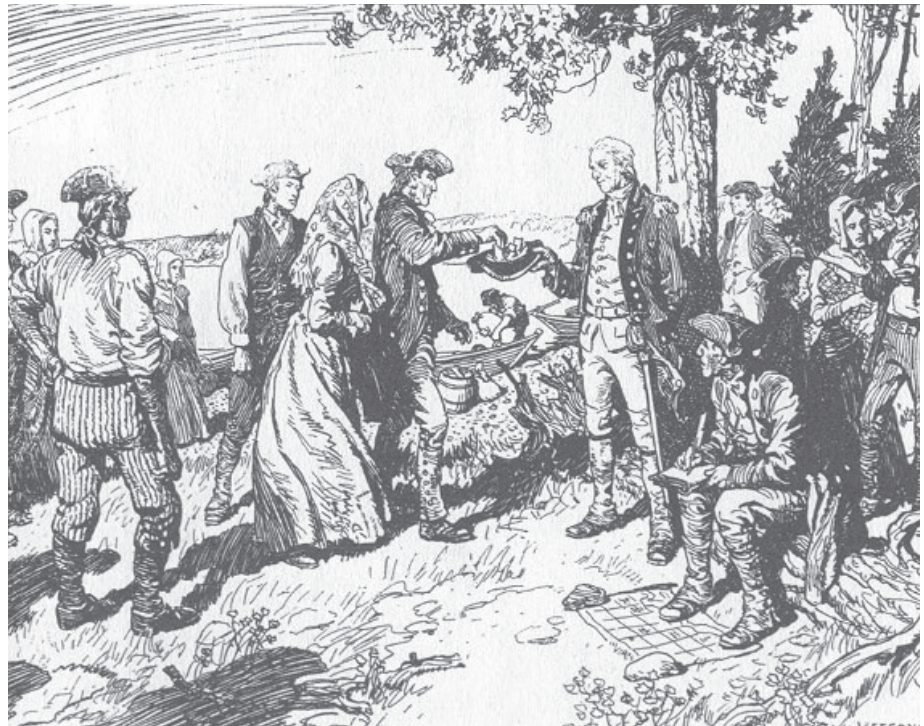
À leur arrivée, les Loyalistes réclament une chambre d'assemblée formée de députés.