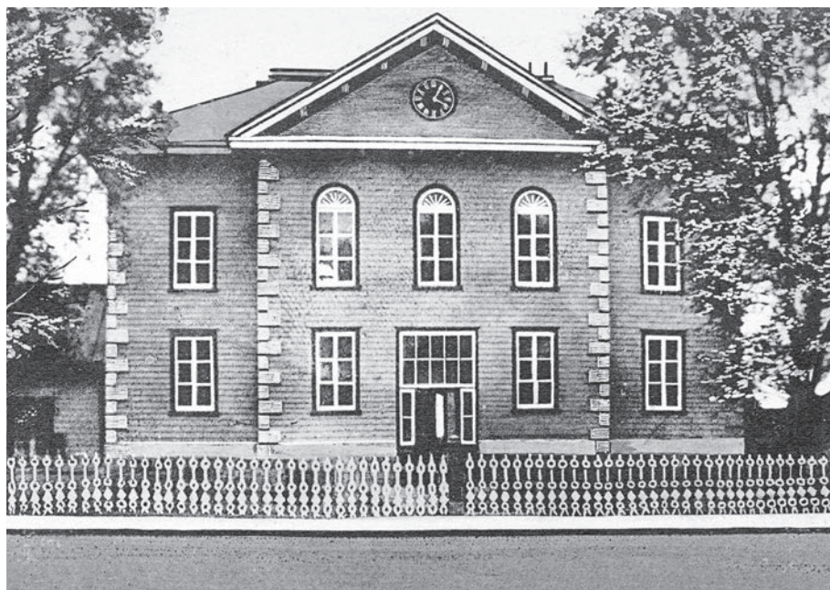
Le palais de justice de New Carlisle, construit vers 1820, est le symbole de ce que représente cette localité en tant que centre administratif et judiciaire de la Gaspésie au 19 e siècle.

Au début du XIX e siècle, la population de la péninsule comptait environ 3 000 âmes et l'économie de la région était l'une des plus dynamiques du pays : l'agriculture, la construction navale, la pêche et la forêt étaient les secteurs les plus florissants. La communauté d'expression anglaise y dominait le paysage économique, social et politique. Sur les 37 nominations politiques recensées entre 1791 et 1841, seules quatre visaient des francophones. En 1851, la population totale était passée à 19 546 habitants, dont la moitié d'expression anglaise. La population anglophone se regroupait principalement dans la région de la Baie-des-Chaleurs et en 1861 elle comptait pour 5 % des anglophones du Québec.