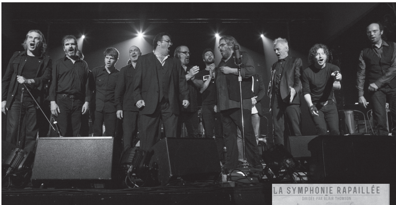
Les 12 hommes rapaillés en compagnie d'Alan Côté à l'église de Cloridorme, 1 er juillet 2012.

gang et d'amitié autour de la poésie. C'est toujours un plaisir pour ces douze artistes de se retrouver et de célébrer un poète qu'ils aiment. Avec Miron, on démocratise la poésie. Le projet Miron, ce n'est pas rien car on est rendu à jouer avec l'orchestre symphonique