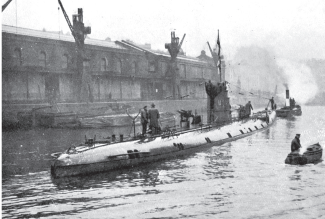
Le sous-marin allemand U-86 capturé dans le port de Bristol en 1918.

devions filer vers notre destination. C'était horrible... à vomir. Nous ne pouvions imaginer une telle tragédie surtout pour nos infirmières dont on apercevait les corps flottants au gré des vagues 2 . »