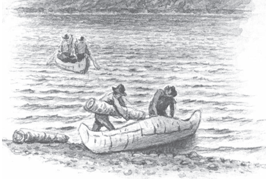
Mi'gmaq chargeant un canot, baie des Chaleurs, fin 19 e siècle. Une particularité du canot mi'gmaq est que sa tonture ou sa partie supérieur des côtés, au centre du canot, est incurvée vers le haut, ce qui protège l'embarcation contre les embruns et facilite son inclinaison sur le côté au moment de sortir du canot des charges lourdes. Image : W.G.R. Hind, Musée MCord, M-11443.

pruches aussi beaux qu'il soit possible de voir pour faire mâts suffisant de mater navires de trois cents tonneaux 3 . »