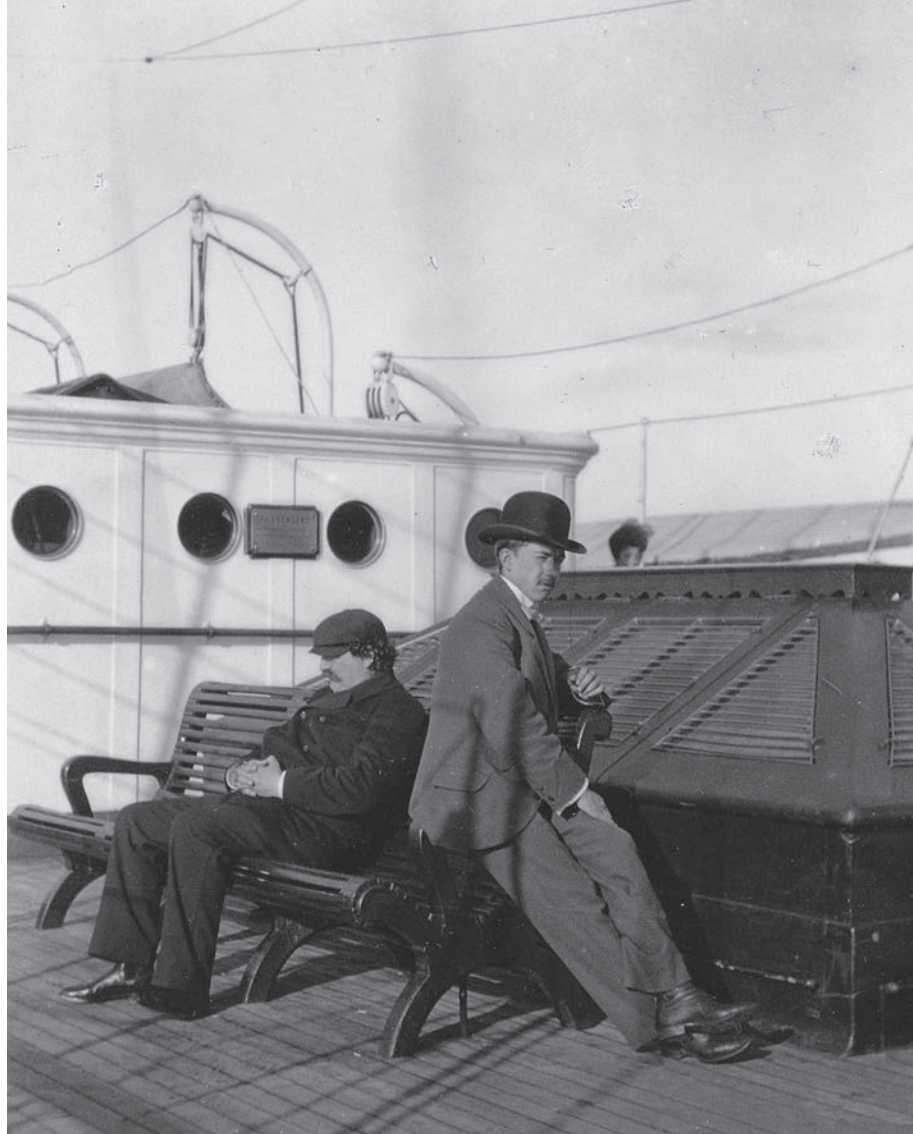
Des passagers se détendent sur le S.S. Parisien, vers 1890-1900.