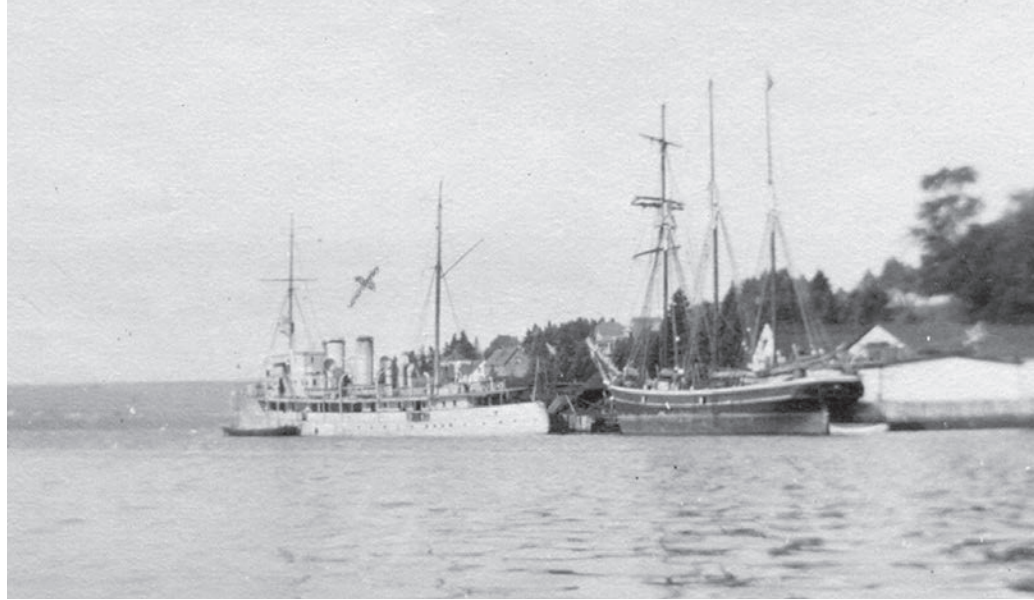
« Gaspé, un des plus beaux havres du monde » accueille le bateau-vapeur Le Margaret et un voilier à trois mâts, août 1919.

Photo : Musée de la Gaspésie. Collection Centre d'archives du Musée de la Gaspésie. P57/1/42