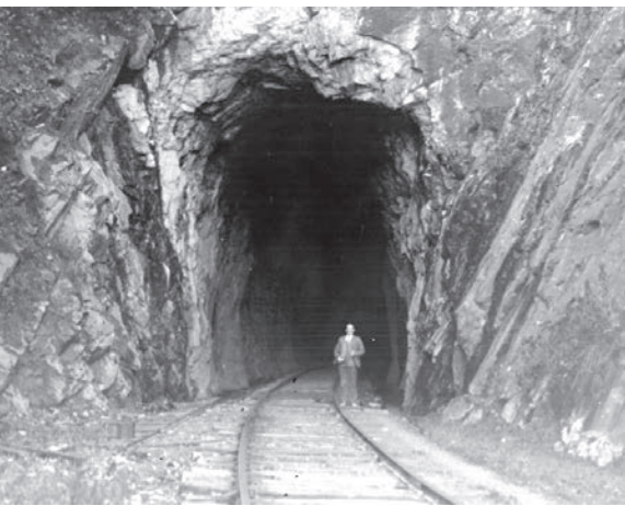
Le tunnel qui perce le cap de l'enfer à Port-Daniel impressionne les voyageurs.

Photo : Musée de la Gaspésie. Collection Centre d'archives du Musée de la Gaspésie. P57/1/42