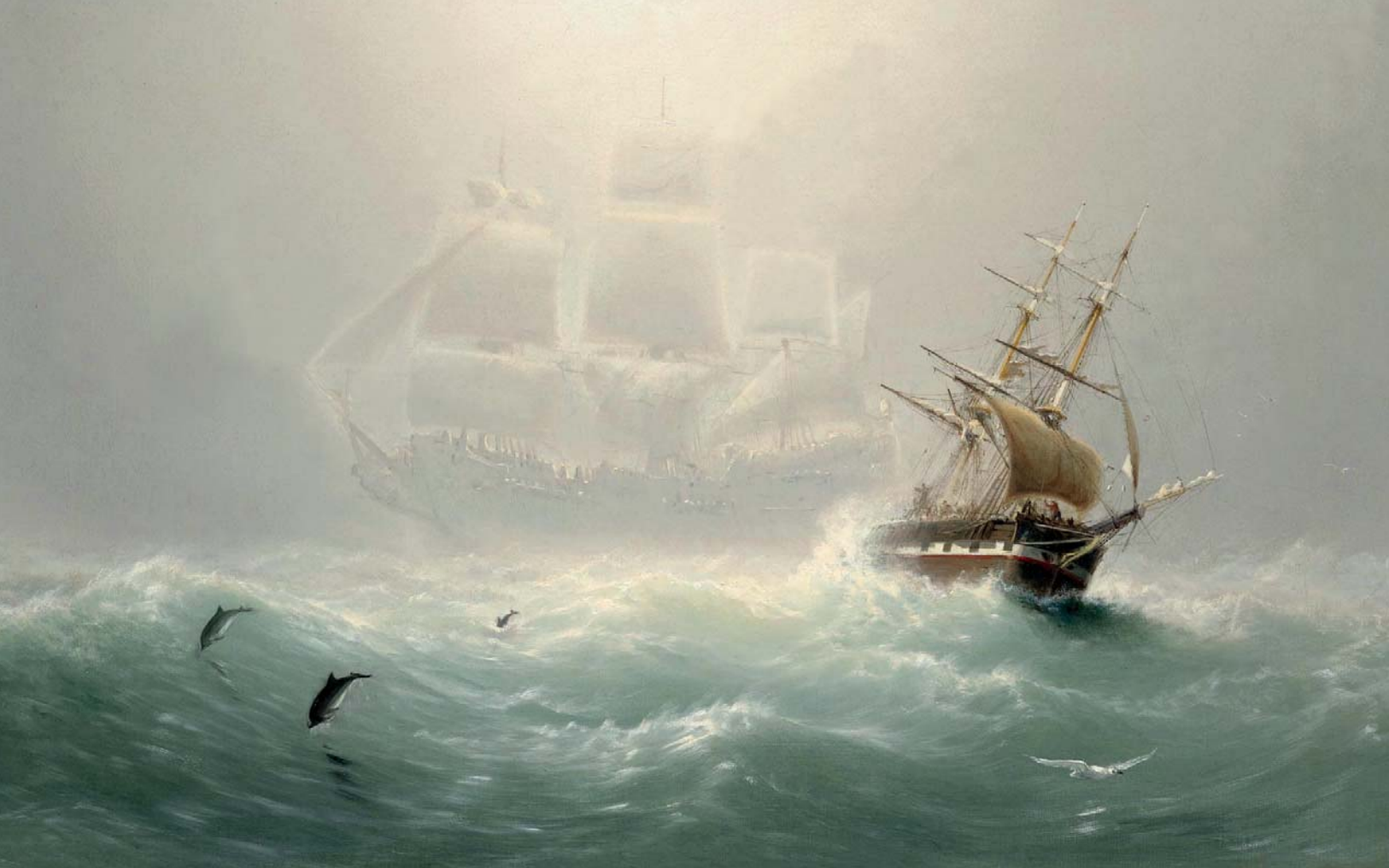
Ce célèbre vaisseau fantôme est mieux connu sous le nom de Hollandais volant en français. Charles Temple Dix, Flying Dutchman , huile sur toile, vers 1860.