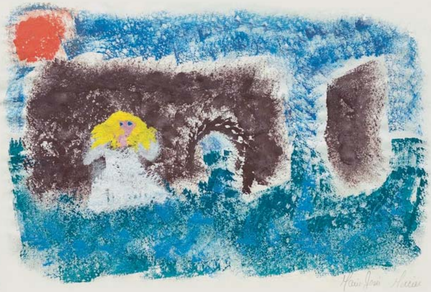
Le fantôme de Blanche de Beaumont continue à jamais de flotter au sommet du rocher Percé, gouache, 1990.