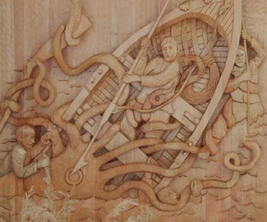
Kraken , tableau sculpté en haut-relief sur pin blanc, 2002.