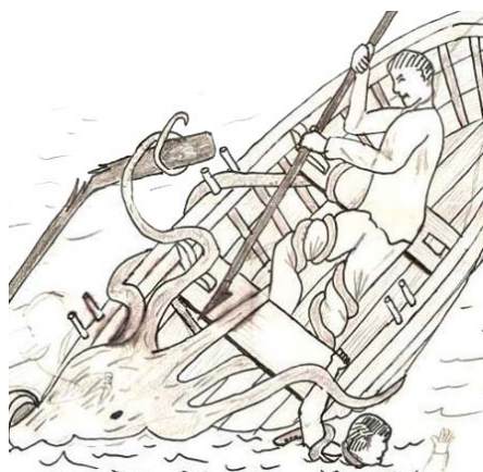
Esquisse de la pièce sculptée Kraken .

Arrivera-t-elle à temps? Y aura-t-il un survivant pour raconter, une fois de plus l'attaque-surprise du monstre des profondeurs, le kraken?