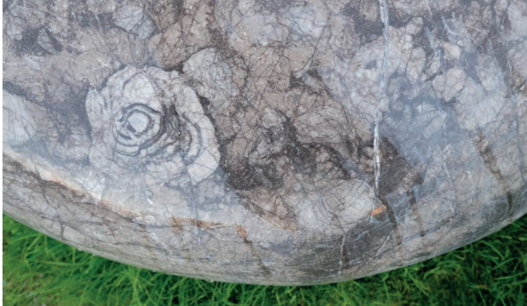
Détail de Tlapataqanji' .