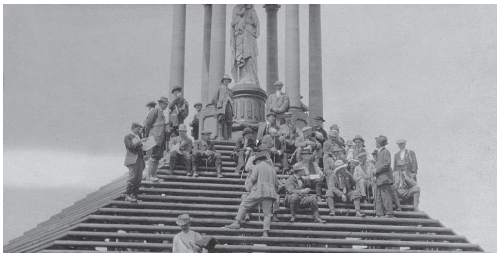
Participants du Congrès géologique international au mont Sainte-Anne, près de Percé, 1913. P247/5/6