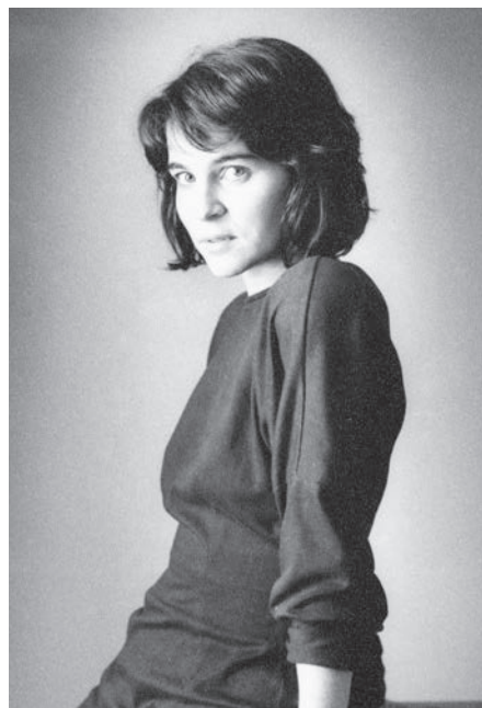
Comme de nombreux clichés de Pordán, les sujets de ces quatre portraits sont non identifiés. Musée de la Gaspésie. P268. Fonds Ladislav Pordán