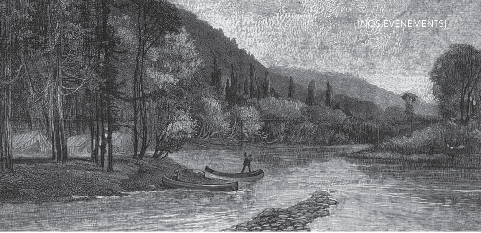
Sketches on the Cascapedia, vers la deuxième moitié du 19 e siècle.

P162/1