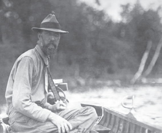
Percy Algernon Taverner, ornithologue au Musée national du Canada de 1912 à 1942, a joué un rôle important dans l'ornithologie canadienne et la conservation de la faune, 1918.