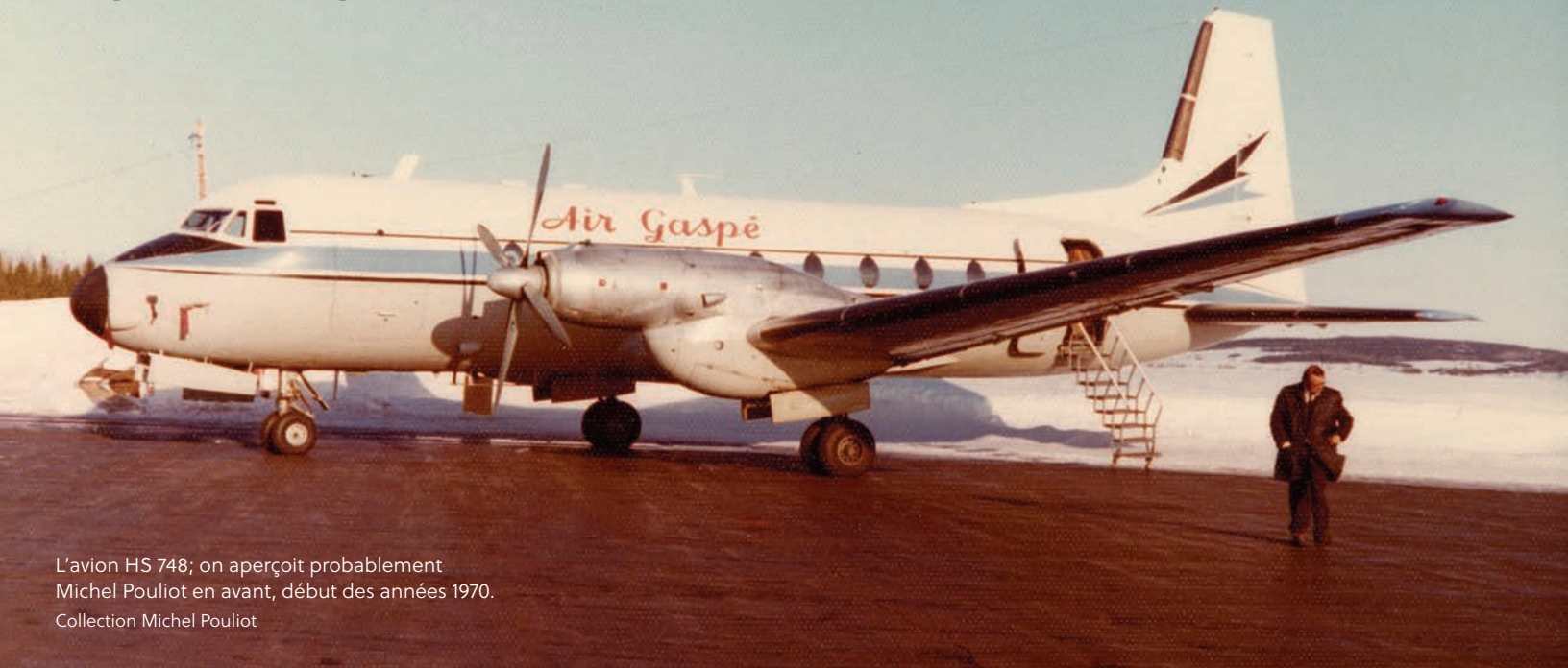
L'avion HS 748; on aperçoit probablement Michel Pouliot en avant, début des années 1970.