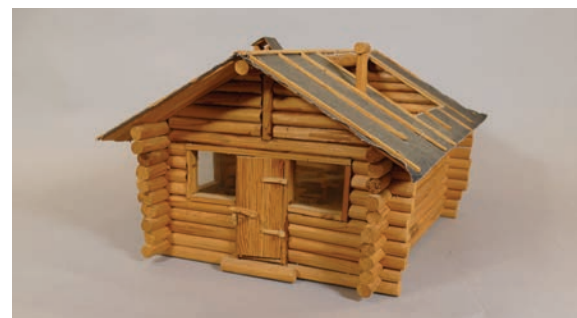
Maquette de la « cookerie » en bois rond, réalisée par Réjean Pipon, vers 1965.

plusieurs formes les souvenirs de son enfance. C'est ainsi qu'il a produit un complexe de camps forestiers avec chacun sa propre vocation. Entre autres, un contient les « beds », c'est-à-dire les dortoirs des travailleurs, et un autre la « cookerie », soit la cuisine et la salle à manger avec ses tables et ses longs bancs. Une ouverture a été pratiquée dans le toit de ces deux maquettes pour nous permettre d'y voir les détails à l'intérieur.