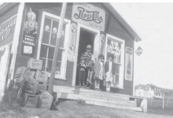
Sur la photo de la maquette du « village des Normand », le petit bâtiment dans la rangée du bas à gauche, entre la maison au toit rouge et celle au toit gris, serait le magasin général de Lucien Normand. On voit ici le magasin général de Cap-aux-Os qui lui ressemble beaucoup, vers 1960.

Certaines des maisons représentées sont toujours debout aujourd'hui. De plus, grâce à une note manuscrite conservée dans le dossier de l'objet, nous savons à qui appartenaient les maisons qui figurent sur la maquette.