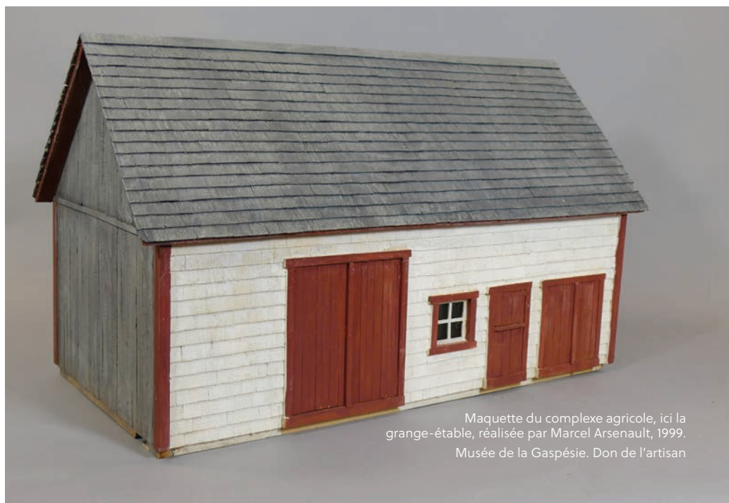
Maquette du complexe agricole, ici la grange-étable, réalisée par Marcel Arsenault, 1999. Musée de la Gaspésie. Don de l'artisan

Objets de beauté et de minutie, les maquettes constituent de véritables archives tridimensionnelles, en plus de susciter l'admiration.