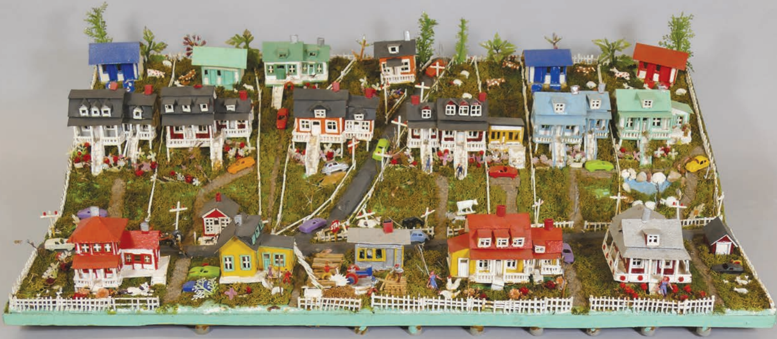
Maquette du « village des Normand », soit Cap-aux-Os, réalisée par Léo Normand, années 1960. On sait, entre autres, que la maison à droite au toit bleu est celle de l'artiste populaire Magella Normand.