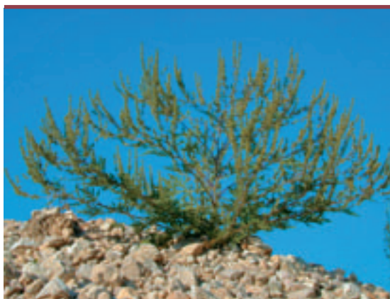
Figure 1. Ambrosia artemisiifolia L.

In France, common ragweed ( Ambrosia artemisiifolia L.) is an invasive species, which most probably originates from North America. This plant is responsible for human health problems as the pollen causes allergic rhinitis and seasonal asthma ; in addition, it engenders agronomical problems as the efficient herbicide treatments are few. Consequently, various departments of the Rhône-Alpes region set up eradication programs for common ragweed. The species is distri-