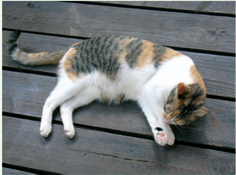
Figure 3. Lola, une chatte à robe calico. L'aspect tigré de type «écaille de tortue» est dû à l'allèle sauvage A. Il est modifié par un gène épistasique (avec les allèles O et o) qui est porté par le chromosome X. Du fait de l'inactivation au hasard des X, la fourrure qui en résulte est unique.