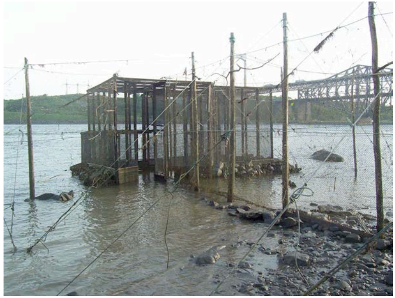
Figure 3. Pêche à fascine de l'Aquarium du Québec, située en amont du pont Pierre-Laporte sur la rive sud du fleuve Saint-Laurent à Lévis, Québec.

Le 25 octobre 2011, un premier spécimen de tanche, un mâle immature de 440 mm (1 146 g), a été capturé dans