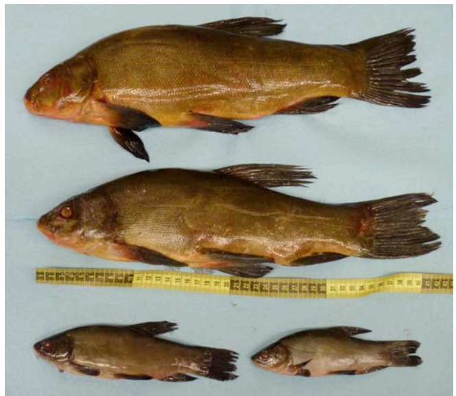
Figure 1. Spécimens de tanche récoltés grâce au Réseau de détection précoce des espèces exotiques aquatiques envahissantes du Saint-Laurent.

Stéphane Masson est coordonnateur scientifique à l'Aquarium du Québec (SÉPAQ).