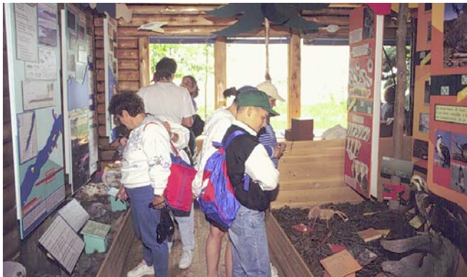
Le centre d'interprétation Philéas-J.-Fillion à l'île aux Basques.