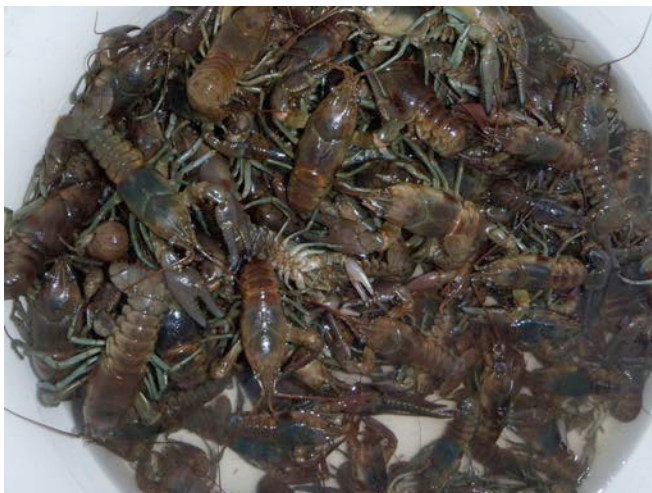
Figure 2. Récolte de 108 écrevisses à taches rouges dans 9 bourolles, le 17 août 2013.

rivage. Lors du relevé du 15 août au matin, 38 écrevisses à taches rouges furent capturées. Elles ont toutes été récoltées dans le but de les éliminer du milieu naturel et également en vue d'éviter leur recapture pour les relevés subséquents. Les bourolles ont ensuite été replacées dans le même secteur (à moins de 3 m du lieu original) puis relevées le jour suivant (16 août) et une dernière fois le 17 août. Curieusement, même si toutes les écrevisses capturées étaient récoltées, chaque relevé a décelé un nombre supérieur de prises : de 38 captures le premier jour, il y en avait 47 le lendemain, puis 108 lors du dernier relevé (figure 2). Ainsi, 193 écrevisses à taches rouges (tableau 1) ont été capturées en 27 jours/piège sur une distance d'environ 30 m, ce qui constitue une densité à la fois impressionnante et inquiétante. Le rapport des sexes des écrevisses capturées dans les bourolles était biaisé en faveur des mâles (1 : 0,7), ce qui s'expliquerait par la plus grande activité des mâles (Hamr, 1997) et la taille des écrevisses était significativement différente entre les sexes ( t = 3,803 , ddl = 141 , p < 0,01 ). Il est