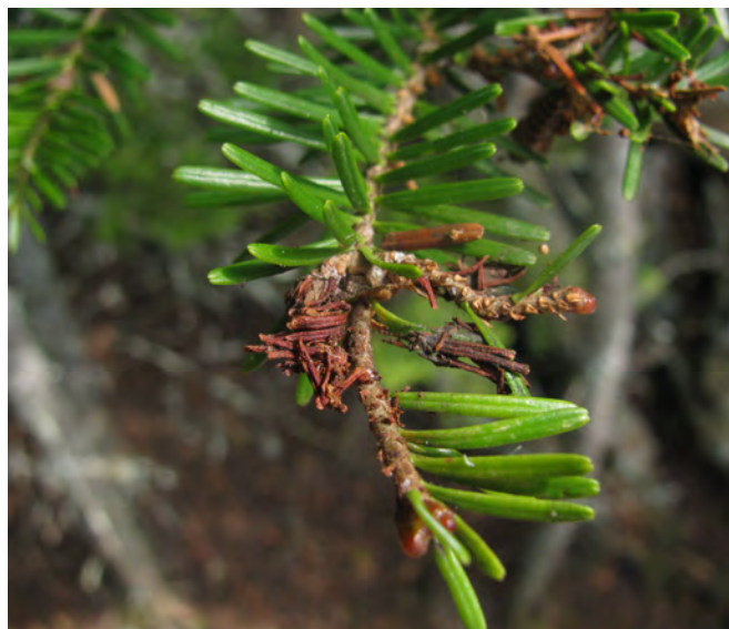
Jeune pousse de sapin attaquée par la tordeuse à l'île aux Basques.