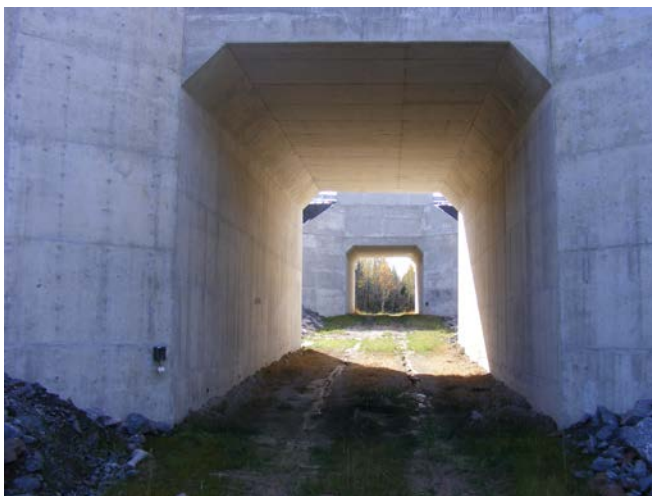
Figure 3. Le passage faunique inférieur (écoduc) de Burwash comprend 2 ponceaux carrés identiques et une ouverture médiane clôturée.

Le pont de Lovering Creek est une nouvelle structure construite au-dessus d'un profond ravin, au fond duquel coule un petit cours d'eau du nom de Lovering Creek. Puisque les parois du ravin sont rocheuses et abruptes, un passage en béton de 1,5 m de large a été construit le long de la paroi nord du ravin, sous le pont, afin de permettre un passage plus stable et sécuritaire pour la faune. Le pont de Lovering Creek représente l'extrémité sud de la clôture d'exclusion faunique installée le long du tronçon de 10 km de l'autoroute 69 à 4 voies. Étant donné que le but premier de la construction de ce pont était de permettre la circulation des véhicules sur l'autoroute, les coûts additionnels impliqués dans la construction du sentier faunique le long de la paroi nord, sous le pont, étaient négligeables.