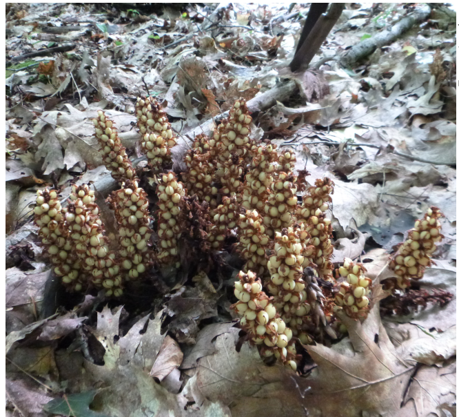
Figure 1. Hampes fructifères du conopholis d'Amérique, région de Rawdon.

La biologie et l'écologie du conopholis ont été étudiées principalement par Baird et Riopel (1986a, 1986b), Haynes (1971), Musselman (1982) et Percival (1931). Le Centre de données sur le patrimoine naturel du Québec (CDPNQ, 2013) propose une synthèse des connaissances acquises. Le conopholis est un parasite obligatoire et incapable de photosynthèse; la plante est dépourvue de chlorophylle et de racines et les feuilles sont réduites à des écailles (figure 1). La nutrition de la plante est entièrement assurée par la plante hôte au moyen d'un tubercule appelé haustorium à partir duquel les hampes florales se développent. Tout débute par la germination d'une graine dont les dimensions sont d'environ 1 mm de longueur par 0,5 mm d'épaisseur. La dormance de la graine est brisée par la perception de substances chimiques émises par une racine de chêne. La radicule émergeant de la graine de conopholis vient en contact avec la racine de l'hôte et pénètre les tissus jusqu'à